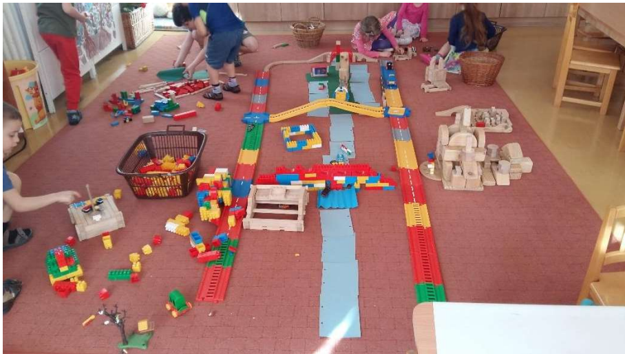
Budapest Duna hidak, Parlament