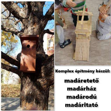
Komplex építmény készül: madáretető madárház madárodú madáritató