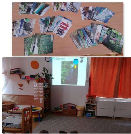
Mimó és Csipek - újrahasznosítás