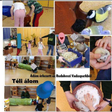
Ádám érkezett az Budakeszi Vadasparkból